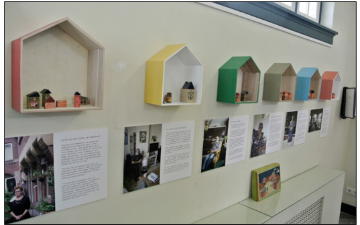
Kleine impressie van de tentoonstelling "100 jaar wonen in Noord"