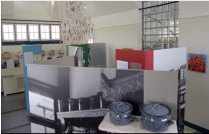
Kleine impressie van de tentoonstelling "100 jaar wonen in Noord"