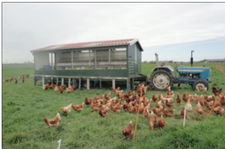
Het land van de oude boerderij waar oa. de kippen rond lopen.

Op de oude boerderij staat het melkvee en op de nieuwe, op nummer 8, vinden we de schapen, geiten, kippen, Kuni kuni varkens, paarden en konijnen. Bijzonder is het mobiele kippenhok: een verrijdbaar hok dat steeds op verschillende plekken op het land gezet wordt zodat de kippen vrij rond kunnen lopen. En dat is allemaal gewoon om de hoek in Zunderdorp.