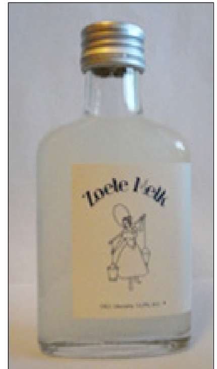
Zoete Melk likorette