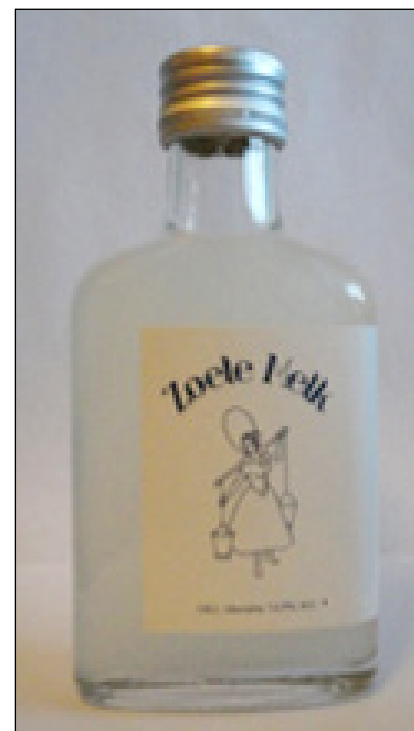
Zoete Melk likorette

Pieter Verhoeven van The Golden Arch, de Vergulden Poort, distilleert sinds 1996 en vanaf sinds 1998 in Amsterdam Noord. Zoetemelk is exclusief verkrijgbaar in Museum Amsterdam Noord voor € 3,75.