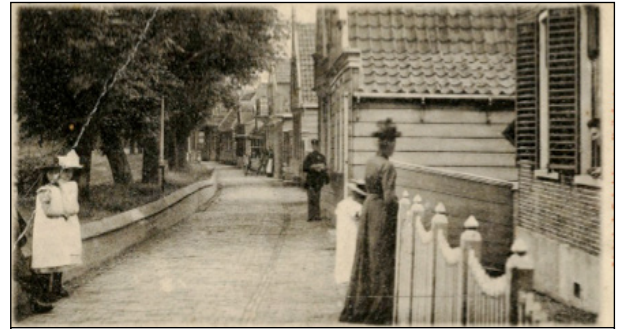
Groeten uit Nieuwendam 1900

Het wandelseizoen begint zaterdag 4 april 13.30 uur met een wandeling van c.a. 2 uur door dijkdorp en tuindorp Nieuwendam. Hans Bergmans neemt u mee langs de prachtige houten dijkhuizen uit de 18e en 19e eeuw. Het dijkdorp beleefde in de 19e eeuw een bloeitijd. Tuindorp Nieuwendam werd gebouwd in de jaren 20 en geldt als een van de mooiste tuindorpen van Europa: 'Amsterdamse School in dorpse stijl'. Sinds enige jaren is het dorp 'beschermd stadsgezicht'.