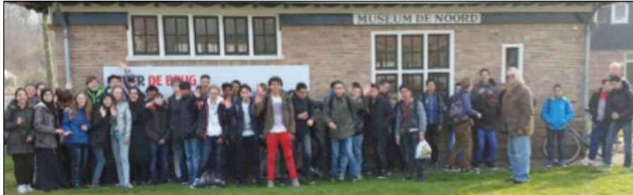
De Tweedejaars Technasiumleerlingen

54 Tweedejaars Technasiumleerlingen waren dinsdag 17 maart op bezoek. Ze gaan in samenwerking met Royal Haskoning DHV de politiek adviseren over de beste manier om per fiets de IJ-oversteek te maken naar Amsterdam Noord. Ter inspiratie gingen ze naar de tentoonstelling.