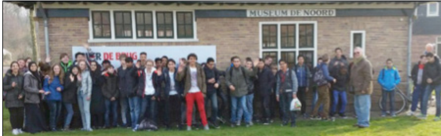
De Tweedejaars Technasiumleerlingen

54 Tweedejaars Technasiumleerlingen waren dinsdag 17 maart op bezoek. Ze gaan in samenwerking met Royal Haskoning DHV de politiek adviseren over de beste manier om per fiets de IJ-oversteek te maken naar Amsterdam Noord. Ter inspiratie gingen ze naar de tentoonstelling.