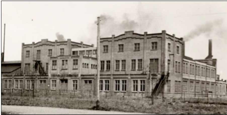
Bron: beeldbank vm Plantenboterfabriek aan de Distelweg 1934

Ook in het heden is er genoeg bedrijvigheid in Noord. Zoals onder meer de vleeswarenfabriek van Canter-Hergo op de Johan van Hasseltweg, Brouwerij De Vriendschap op het Melkwegterrein en de Chocolademakers, die het gehele productieproces zelf in de hand hebben van cacao boon aangevoerd per zeilschip tot het transport per bakfiets naar de verkooppunten.