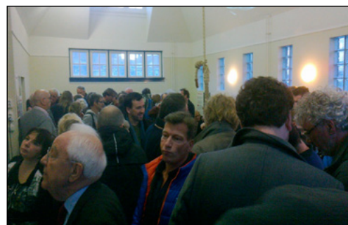
Drukte op de eerste dag van de tentoonstelling.

Op 30 januari werd onder grote belangstelling de tentoonstelling 'Over de brug' geopend. Maar de toeloop beperkt zich niet tot de opening. Alle dagen zijn tot nu toe druk bezocht. De expositie mocht zich verheugen in veel aandacht in de pers. De plannen voor een vaste oeververbinding trekken veel belangstellenden. Ook de actieve elementen vallen in de smaak. Je kunt je eigen brug bouwen van lego of een schets maken in het schetsboek. Er is veel te lezen op de tentoonstelling, voor wie daar moeite mee heeft is er een audiotour.