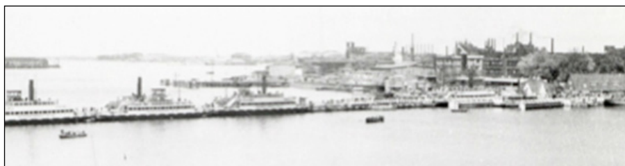
1945 pontenbrug Buiksloot.

Sinds de 19e eeuw zijn er al plannen voor een brug over het IJ gemaakt. Nu Amsterdam Noord booming is komen er steeds meer fietsers die de op de overvolle ponten het IJ moeten oversteken. In de afgelopen 150 jaar is de roep om een vaste verbinding met het centrum regelmatig te horen geweest. Kan het wel?