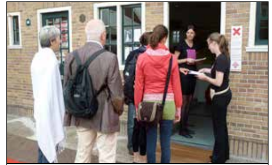
Vrijwilligers aan het werk

Zoals u weet drijft het Museum Amsterdam Noord op vrijwillige medewerkers wier taak vooral als gastvrouw of gastheer bezoekers ontvangen is. Vooral bij een voor deze medewerkers arbeidsintensieve tentoonstelling, merken we, dat we qua aantal krap in de medewerkers zitten. Daarom de vraag eens na te denken of meedoen in het museum niet ook iets voor u, uw buurvrouw, uw oom of goede kennis is. Aanmelden kan dag en nacht per e-mail naar hjcras@gmail.com . Daarna volgt een vrijblijvend kennismakingsgesprek.