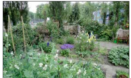
Groentetuinite IJ-plein van Tine

Wat wordt en werd er zoal in ons Stadsdeel gemaakt? Hoe gaat de toekomst er uitzien met de metropolitane landbouw? Aan de orde komen onder meer: melk en kaas, de zuivelproducten zoals die vroeger en nog steeds gemaakt worden op de boerderijen; het kweken van groenten in de moes- voedsel en school-, volks- en huidige voedseltuinen; de visserij van de Waterlandse dorpen; de ambachtelijke fabriekjes die drop fabriceerden, koek en vleeswaren, de chocoladefabriek, bierbrouwers en wijnmakers. Allemaal uit Noord!