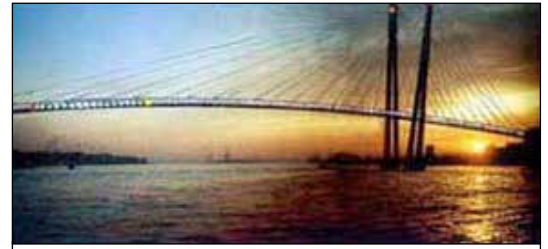
De luchtbrug van Flip van den Bergh

Flip van den Bergh ontwierp een luchtbrug en - nog recenter - architecte Jolijn Valk concipieerde in 2010 een fascinerend stukje niemandsland, zwevend boven het water.