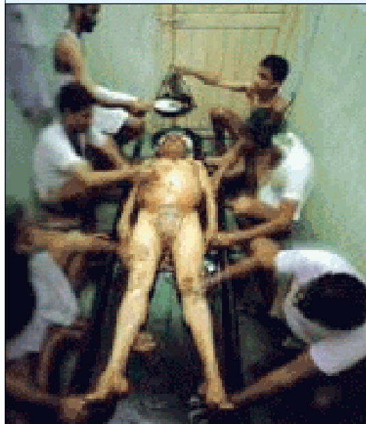
Ayurveda, geneeskunde uit India

De medewerkers van het museum treden nog een keer op. Na afloop is er een lunch.