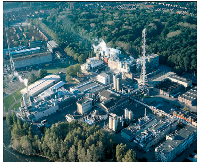
Het terrein van het vroegere Ketjen

Ketjen was bijna een eeuw lang de zwavelzuurfabriek die in een bocht van wat nu de Zamenhofstraat heet tegen het IJ aan was gevestigd. Dat was in overeenstemming met het besluit van de Gemeenteraad eind 19e eeuw, om in Noord alleen gevaarlijke fabrieken (en scheepswerven) te vestigen. De schoolkinderen in Noord hadden dan ook beduidend vaker aandoeningen van de ademhalingswegen dan kinderen aan de andere kant van het IJ. De mensen in Noord weten dat veelal aan de dampen waarmee Ketjen regelmatig de lucht vervuilde. En als de wind uit het zuidwesten kwam, kon je je was niet buiten te drogen hangen, want dan vielen er gaatjes in. Ook dat kwam natuurlijk door het zwavelzuur.