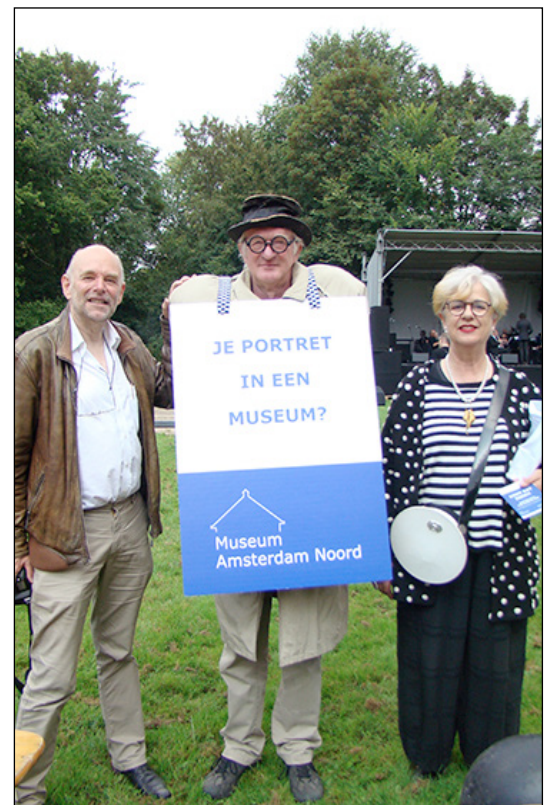
Het team van Museum Amsterdam Noord tijdens het Noorderparkfestival.

27 en 28 september nemen de nodige mensen de moeite om naar het museum te komen om de daar tentoongestelde foto's op te halen, wat vaak gecombineerd wordt met een bezoek aan de scholententoonstelling. Als je het mij vraagt, is dit voor herhaling vatbaar."