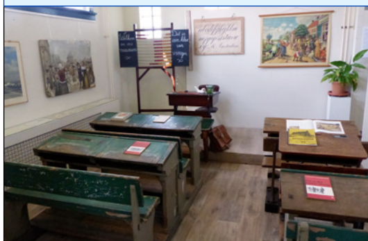
Leslokaal uit de jaren vijftig

Donderdag 18 september 13.30 uur wandelexcursie Bijlmermeer.