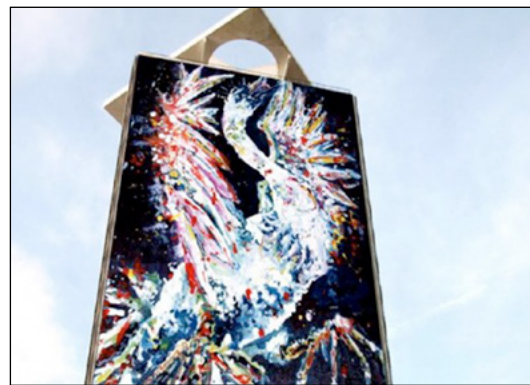
De Zwaan op het voormalige Shell toren

Het was een goede keuze om als dierlijke representant van geheel Noord een zwaan op de Toren Overhoeks te laten schilderen. De keuze van Rombout Oomen als de kunstenaar die de zwaan heeft geschilderd was daarbij bijzonder trefzeker.