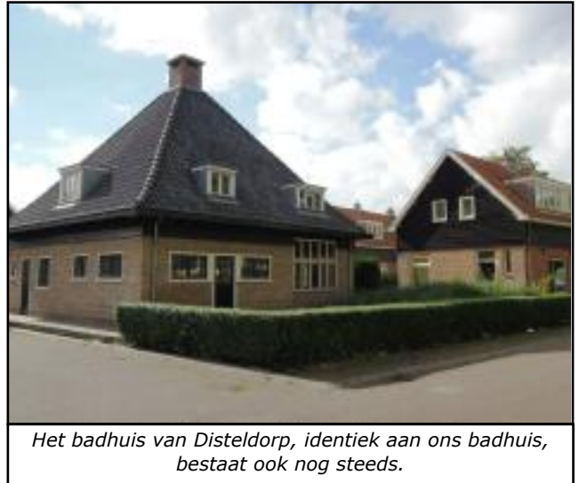
Het badhuis van Disteldorp, identiek aan ons badhuis, bestaat ook nog steeds.

Van gemeentewege werden in Amsterdam 21 volksbadhuizen gebouwd. Hun verspreiding over de stad is op de tentoonstelling op een kaart te zien. Pas in 1933 werd het verplicht om bij nieuwe woningen een douchecel in te bouwen. De meeste mensen maakten daar dankbaar gebruik van om de stofzuiger en de strijkplank er in op te bergen. Gemeenteambtenaren bedachten intussen het badfrequentiecijfer. Dat was het aantal keren dat je per jaar een bad nam. Als je elke week een gezond bad zou nemen, was je ideale badfrequentiecijfer dus 52. Bij bestudering van de bezoeken aan de badhuizen kwam men echter niet verder dan 5. Het aantal keren dat de gemiddelde burger zich op zaterdag bij de keukenkraan poedelde, werd blijkaar niet meegeteld.